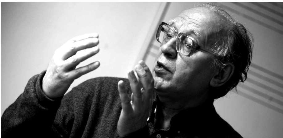
Valentin Silvestrov na FF MU v Brně, 2010

současné ukrajinské kultury, který měsíc předtím za dramatických okolností opustil Rusy pustošenou Ukrajinu a od té doby žije v Berlíně. Na youtube hojně zdokumentovaný incident, proběhnoucí paradoxně až ve druhé, schubertovské polovině večera, ovšem poté, co se úřady neúspěšně pokoušely vyprodaný koncert zrušit už během dne, má všechny atributy gogolovské satiry. Dva policisté nejprve nakráčejí na pódium a hlasitě oznámí ukončení koncertu. V sále je rušno, někteří lidé odcházejí, většina vše svými telefony filmuje, ale Ljubimov hraje dál, Schubertova impromptu znějí idylicky až naivně. Policisté odkráčejí z pódia k východu ze sálu a nevědí, co dál. Začne další impromptu, opět přicházejí stejní dva policisté, zjevně dostali nápad: hlásí, že v budově byla oznámena bomba. Hlasitě hovoří k Ljubimovovi, ten hraje dál. Zkouší to na publikum, nic. Impromptu skončí, Ljubimov sklídí hlučný aplaus. Koncert je přerušen, prý na 15 minut, než dorazí policejní psi. Ti ale dorazí až za dvě hodiny.